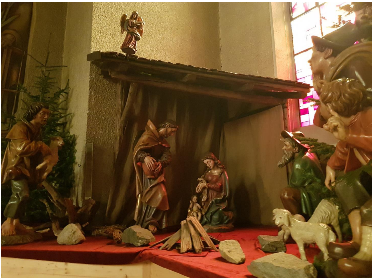
Lebensgroße Weihnachtskrippe in der Hl.-Kreuz-Kirche in Lana (Ausschnitt)

Zündet am Baum die Kerzen an, singt Lieder und dann denkt daran, Vielleicht wird es in dir auch still.